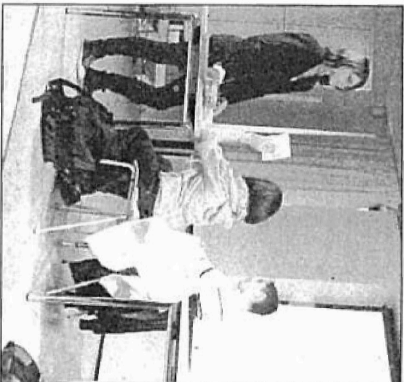
La scène professeur-élèves : un cas analysé par les élèves.