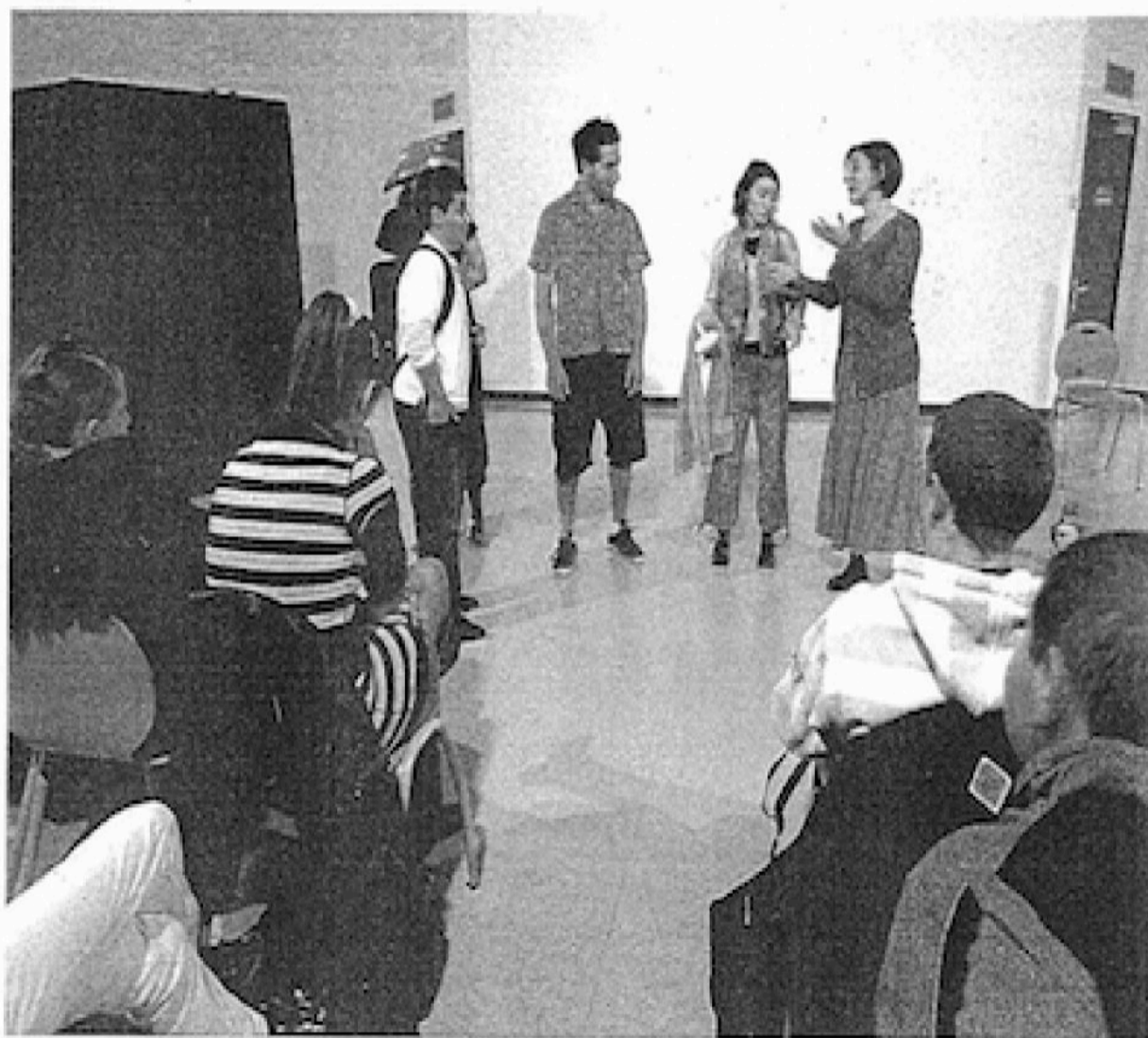
Au collège Nadaud à Wattrelos, les collégiens sont montés sur scène pour prendre la place des personnages.

Sur scène, cinq comédiens miment de drôles de situations. C'est aux collégiens de leur donner sens. On parle solidarité, rejet, relation garçons-filles... Chacun y va de son interprétation et les paroles fusent : « les autres la rejettent », « les garçons se croient plus forts que les filles », « ils n'ont pas de solidarité avec elle »... Et pendant qu'ils parlent, l'ani-