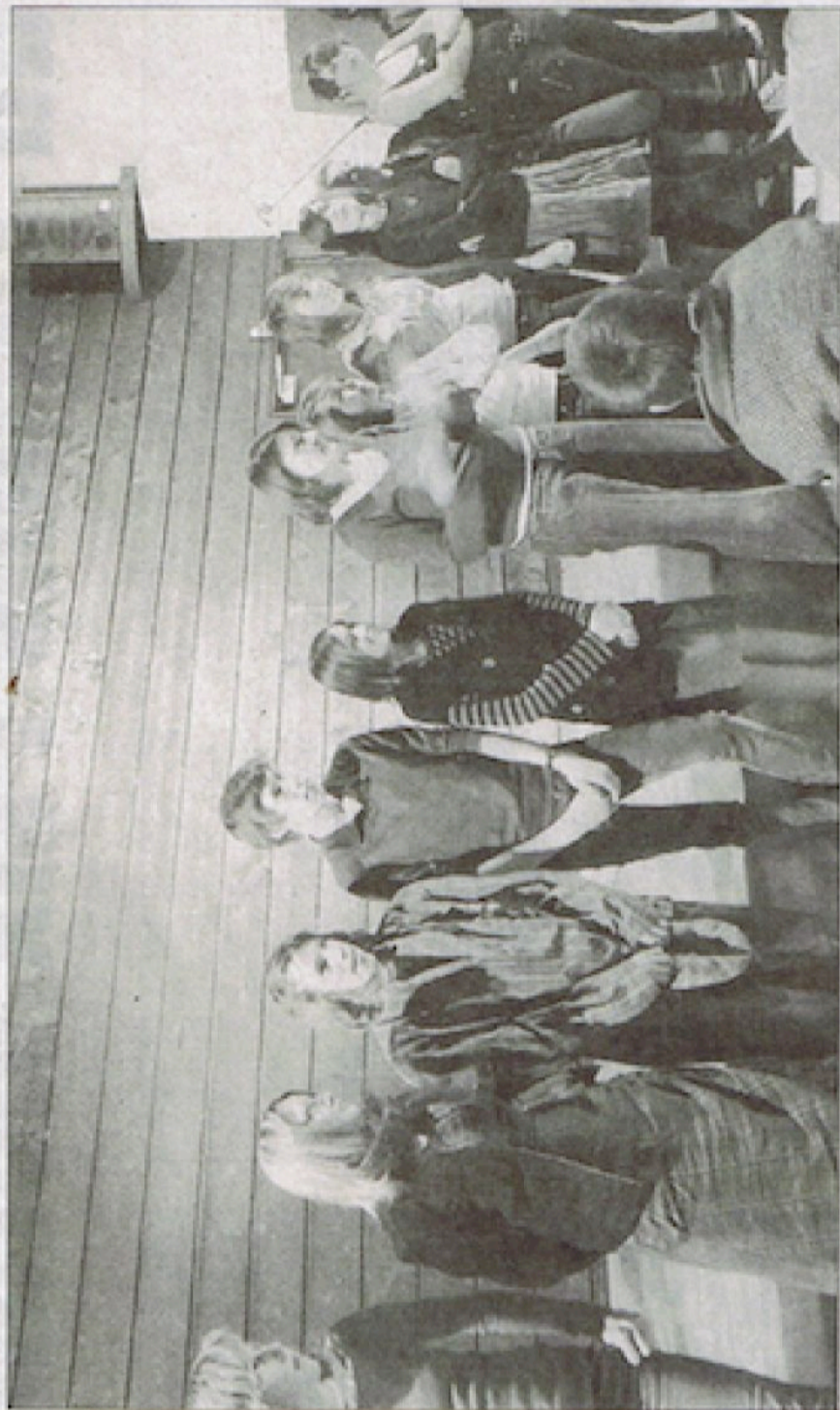
Une douzaine d'ados ont tenté d'apporter une réponse aux problèmes des « opprimés ».