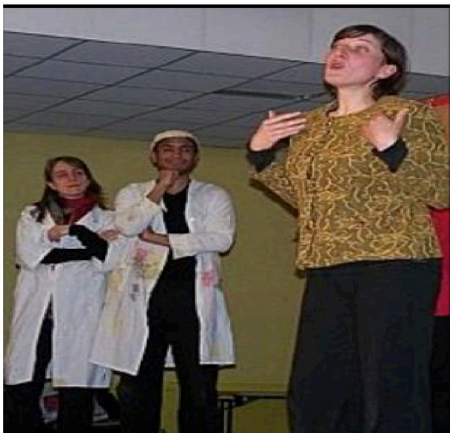
Les salariés de structures d'insertion, comme la régie de quartier, jouent les acteurs, pour mieux débattre et s'informer.